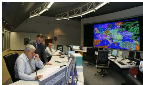
Центральная диспетчерская ПАО «Газпром».

В нефтегазовой отрасли Российской Федерации ООО «ПСИ» поставляет программное обеспечение и выполняет работы по созданию диспетчерских систем для ПАО «Газпром» и ведущих нефтяных компаний.